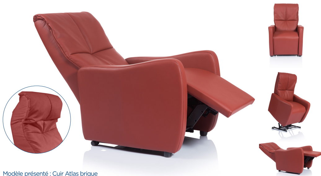
Modèle présenté : Cuir Atlas brique